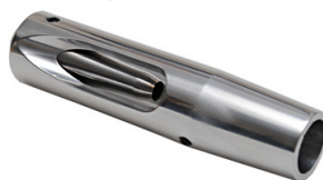
Compensador Rowan Engineering Uso vedado